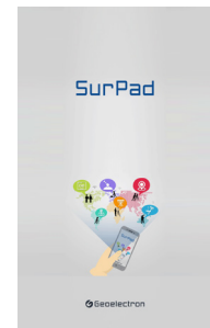
측량 App Surpad 4.2