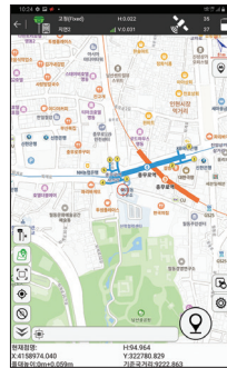
네이버 지도 지원