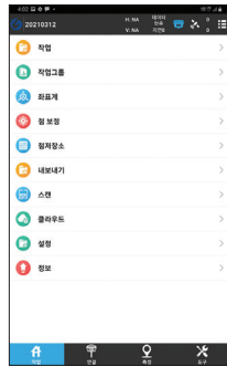
다양한 측량 기능