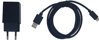
충전기 및 케이블